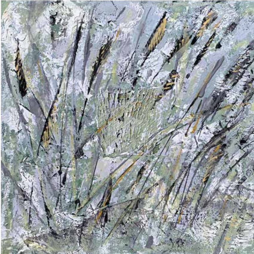
„Gräser im Winter“, Acryl auf Leinwand, 40 x 40 cm, 2023

S.1: „Borgwall“, Krakow am See, Tusche auf Papier, 15 x 20 cm, 2020