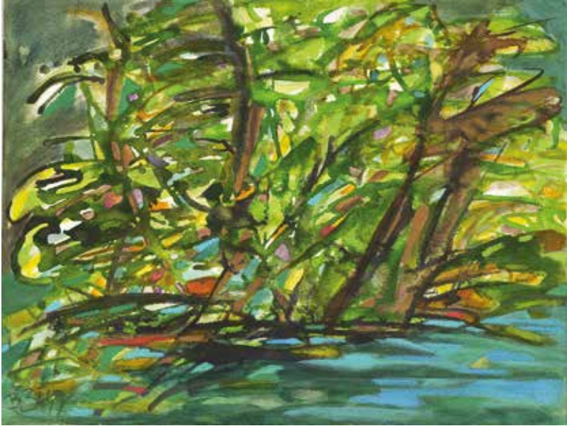
„Am Borgwall“, Krakower See, Tusche auf Papier, 36 x 48 cm, 2017

Empfinden der Malerin, ja eine existenzielle Erfahrung: die Erinnerung daran, dass wir Teil eines Zusammenhangs sind, der größer ist als wir selbst und unsere stets begrenzten Zwecke und Wege. Im Innewerden dieser Erinnerung öffnet sich uns aber zugleich der Horizont eines hohen Anspruchs: des An-Spruchs, sich als Mensch dessen bewusst zu sein und damit auch der damit einhergehenden Forderungen aus einem unser Selbst transzendierenden Bereich – ein Anspruch, der zugleich erhöht und demütig macht.