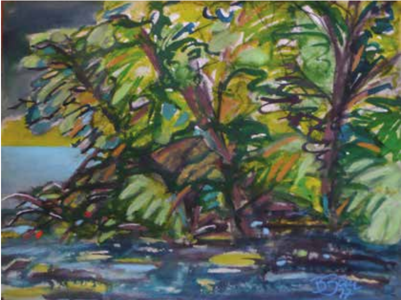
„Am Borgwall“, Krakower See, Tusche auf Papier, 36 x 48 cm, 2017

romantische Gedanke einer verborgenen Einheit von Mensch und Natur, eines Zusammenklangs des Gefühls für das Selbst mit dem Gefühl der Zugehörigkeit zur Natur – einer „blauen Blume“ der Sehnsucht – scheint bei ihr in zeitgenössischer Bildsprache fortzuklingen. Wenn Novalis sagt: „Immer nach Hause“, dann meint er kein Zurück. Er meint eine Bewegung des Werdens und Unterwegsseins. Die hier versammelten Landschaftsmalereien laden nicht ein, irgendwohin zu fliehen. Sie laden ein, zu verweilen, zu sehen, um im Sehen so vielleicht einen Moment lang im schon immer Bergenden anzukommen.